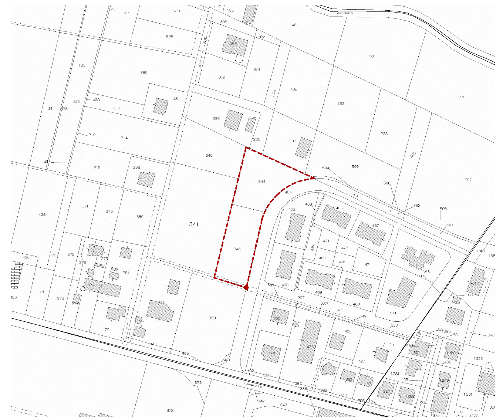
ESTRATTO DI MAPPA scala 1:2000 Fg. 9 Mapp. 344-345