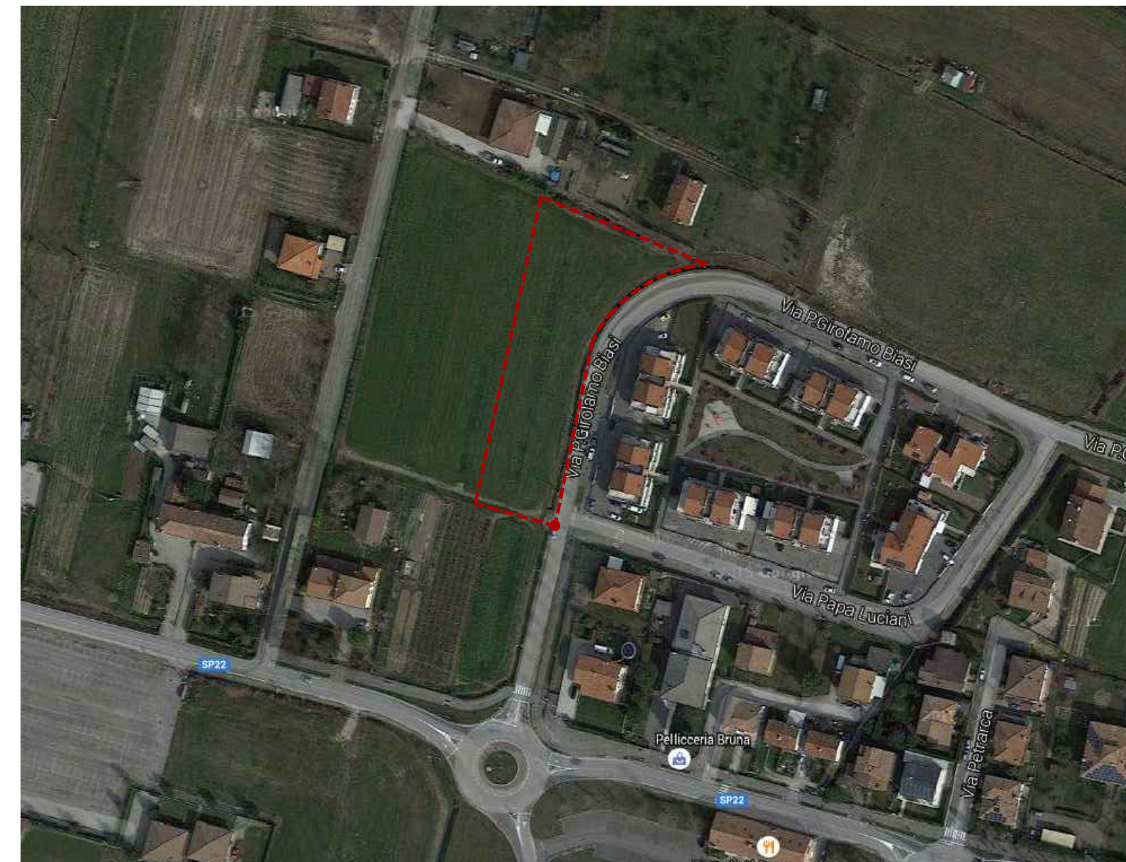
AEROFOTOGRAMMETRICO scala 1:2000