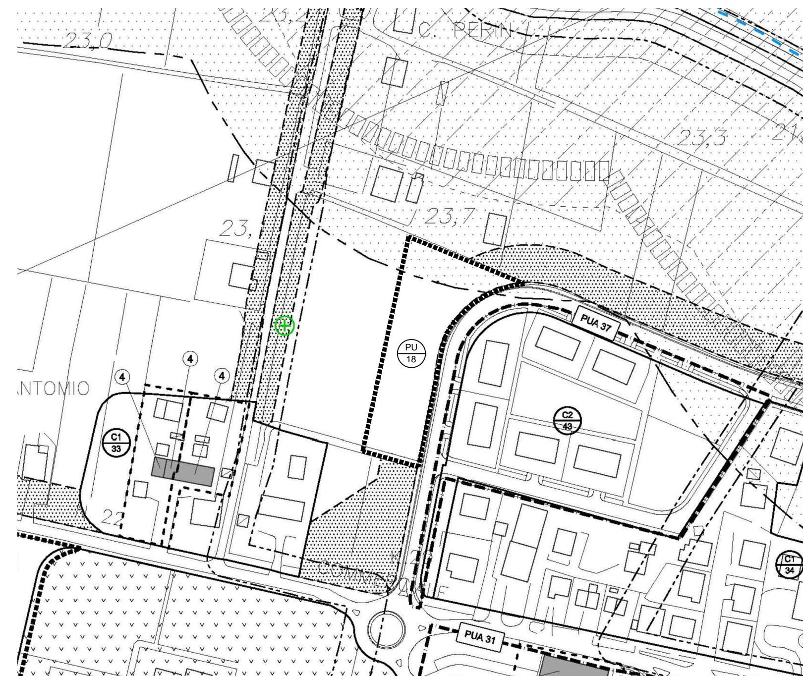
ESTRATTO P.I. - VARIANTE N.16 approvata con D.C.C. n.16 del 27/04/2018 scala 1:2000